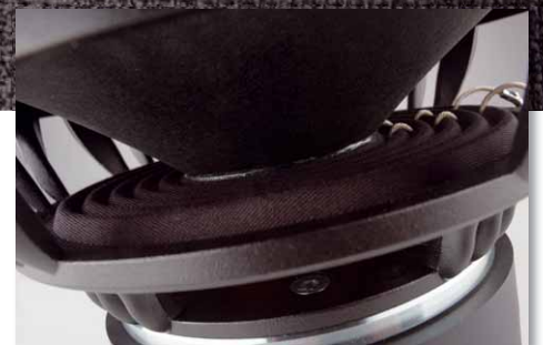
Auch Details wie Zentrierspinne und Litzenführung sind beim PRO 10 vom Feinsten

weg mit einem Subwoofer. Und der erinnert verdächtig an den Aerospace 10. Das liegt vor allem am bildschönen Druckgusskorb, den der PRO direkt vom Aerospace geerbt hat. Diese einzigartige Konstruktion entstand durch Computersimulation und zeichnet sich durch ein asymmetrisches, strömungsoptimiertes Design aus – mit Sicherheit der aufwendigste und highendigste Subwooferkorb am Markt. Da lag es nahe, für den PRO nicht das Rad neu